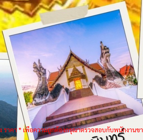
วัดถ้ำกษัตริย์