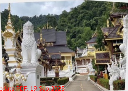
วัดป่าเขตวัน