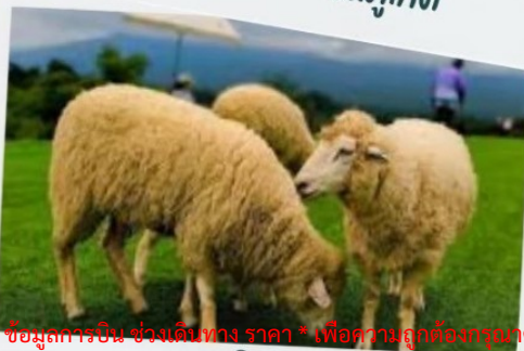
ฟาร์มแกะ