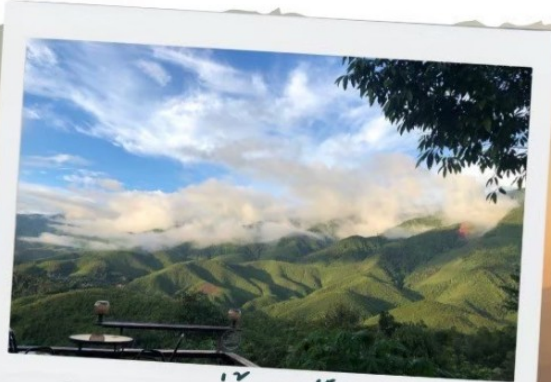
หมู่บ้านสะปัน