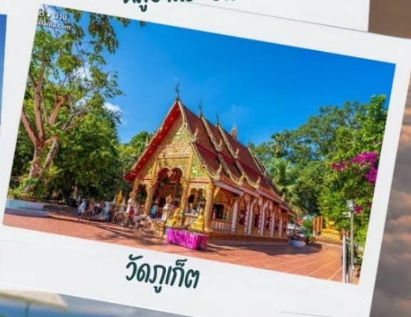
วัดภูเก็ต