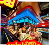
บูฟเฟต์ซีฟู้ด