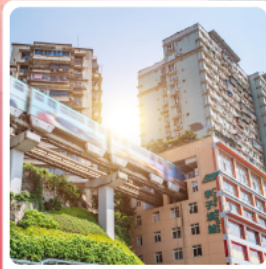
รถไฟฟ้ากะลุ่ตึก