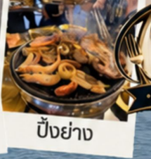
ปิ้งย่าง