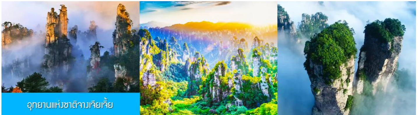
อุทยานแห่งชาติจางเจียเจีย

พักที่ TUWANGJU HOMESTAY โฮมสเตย์ในเมืองโบราณผู่หรงเจิน