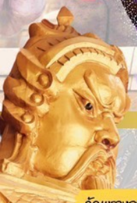
วัดแทงองค์ปัจจุบัน