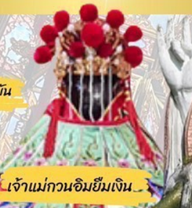
เจ้าแม่กวนอิมฮิมเงิน