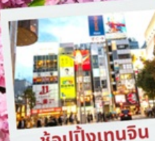
ช้อปปิ้งเทนจิน