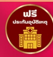
ฟรี ประกันอุบัติเหตุ