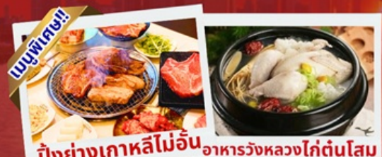
ปิ้งย่างเกาหลีไม่อื่น อาหารวังหลวงไก่ตุ๋นโสม