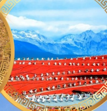
ความประทับใจแห่งลี่เจียง