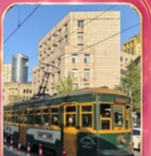
ขั้วรถรางไฟฟ้าชมเมือง