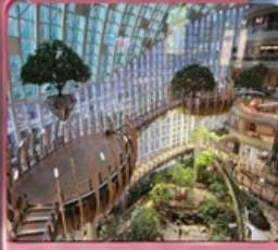
ห้างการค้าเดินถ่วงหวน