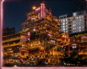
ชมแสงสีหยาต้ง