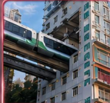
นั่งรถไฟทะลุติ๊ก 2 สถานี