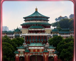
ศาลาประชาคม (ชมด้านนอก)