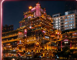
ชมแสงสีหงหยางตั้ง