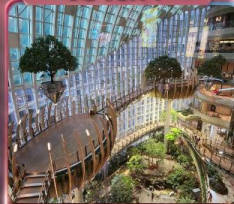
ห้างการค้าเดินที่กว้างหวน