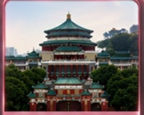
ศาลาประชาชน (ชมด้านนอก)