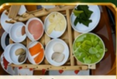
ขนมจีนข้ามสะพาน