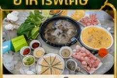
ชาปูเหิด