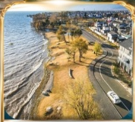
ทะเลสาบเอ่อไห่ โค้งตัว S