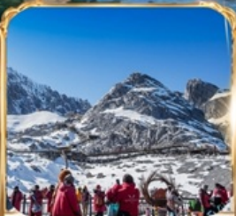
ภูเขาหิมะมังกรหยก +กระเช้าใหญ่