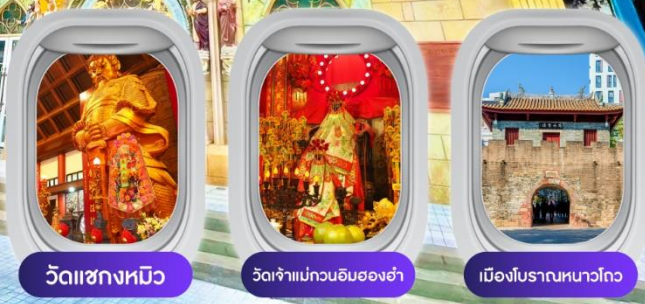
วัดฯชางหมิว วัดเจ้าแม่กวนอิมฮ่องกง เมืองโบราณหนาวโกว