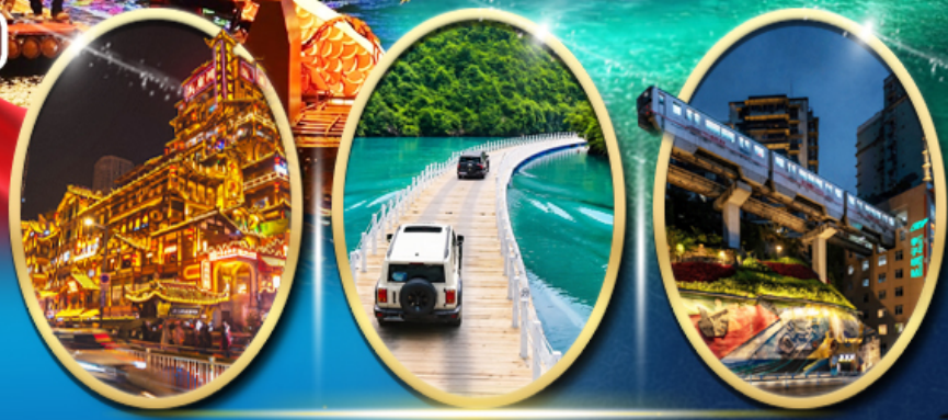
หงหยาดัง ประตูลิงโตแห่งเซวียนเอิน รถไฟฟ้าทะเลลึก

ราคา เริ่มต้น 20,919 บาท รวมภาษีมูลค่าเพิ่ม 7%