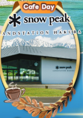
Snow Peak Land Hakuba