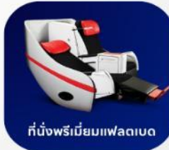
ที่นั่งพรีเมียมแพลนเบด

บริการอาหารร้อน และ น้ำดื่ม บนเครื่อง ขาไป และ ขากลับ