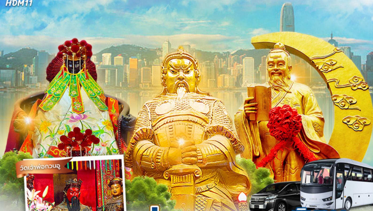
วัดเจ้าพ่อกวนอู