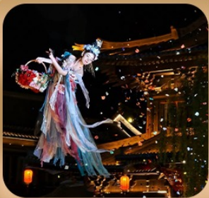
“เมืองโบราณล้วยอี้”

ชมถ้ำหลงเหมิน มรดกโลกที่เมืองล้วหยาง • สุสานจิ้นซีฮ่องเต้ • ศาลเจ้ากวนอู วัดเส้าหลิน + ป่าเจดีย์ + ชมโชว์กังฟู • เมืองโบราณล้วยอี้ • อุทยานหุ่นโก่ซาน เจดีย์ห่านป่าใหญ่ • ถนนวัฒนธรรมต้าถิง • ถนนคนเดินอิสลาม • จัตุรัสหอรบะซิง