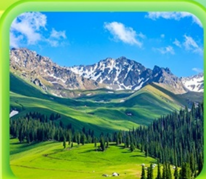
"กุ้งหน้านาราถึ"