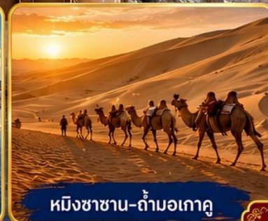
หมีงซาซาน-ถ้ำมอเกาคู