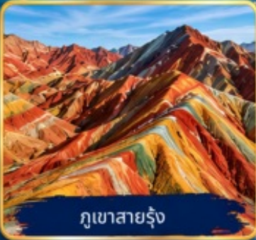
ภูเขาสายรุ้ง