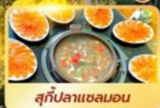
สุกี่ปลาแซลมอน