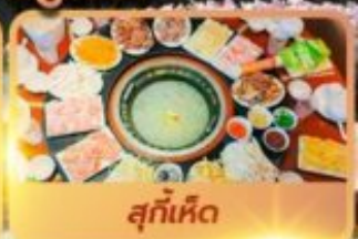
สุกั้เห็ด