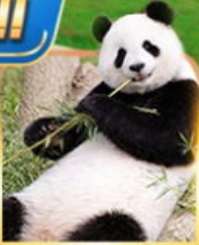
สวนสัตว์ฉงชิ่ง