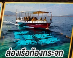
ล่องเรือก้องกระเจก