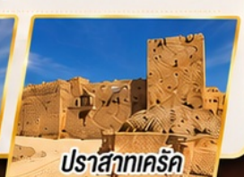
ปราสาทเคิร์ค