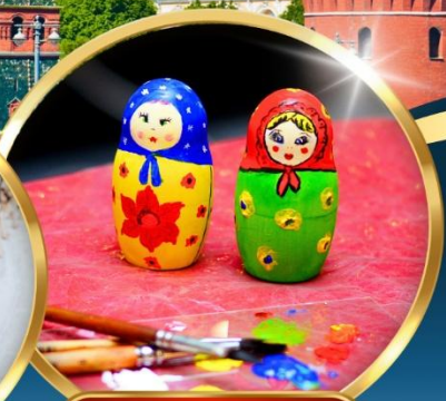
• MATRYOSHKA PAINTING •

🧳 น้ำหนักกระเป๋า 30 กิโล 🛡️ รวมประกันการเดินทาง 🏨 พักโรงแรม 4 ดาว 🍴 อาหาร 15 มื้อ