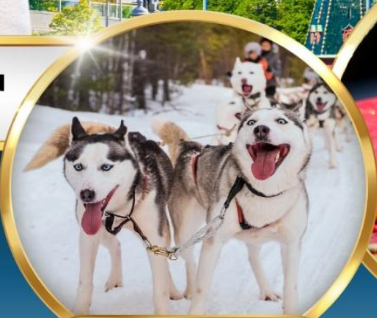
• SAAMI VILLAGE •