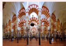
สุหร่าเมซกิต้า

** พักที่ Eurostars Granada Hotel 4* หรือเทียบเท่า **