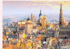
เมืองโทเลโด

** พักที่ Eurostars Toledo Hotel 4* หรือเทียบเท่า **