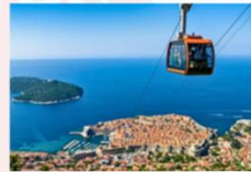
Cable Car Ride