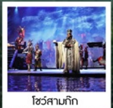
โชว์สามก๊ก