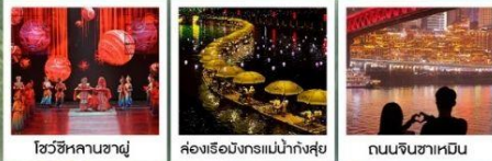
โชว์ซีหลานซาตู้