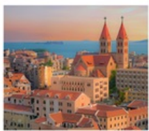
โบสถ์ ST. EMIL