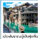
เมืองโบราณกุ่ป๋ายสู่ยเจิน