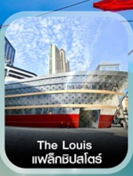
The Louis 11ฟ्लीทชิป 11