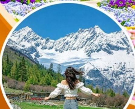
ภูเขาสี่ดรุณี ช่วงเลียวโกว (รวมปรดอุทยาน)