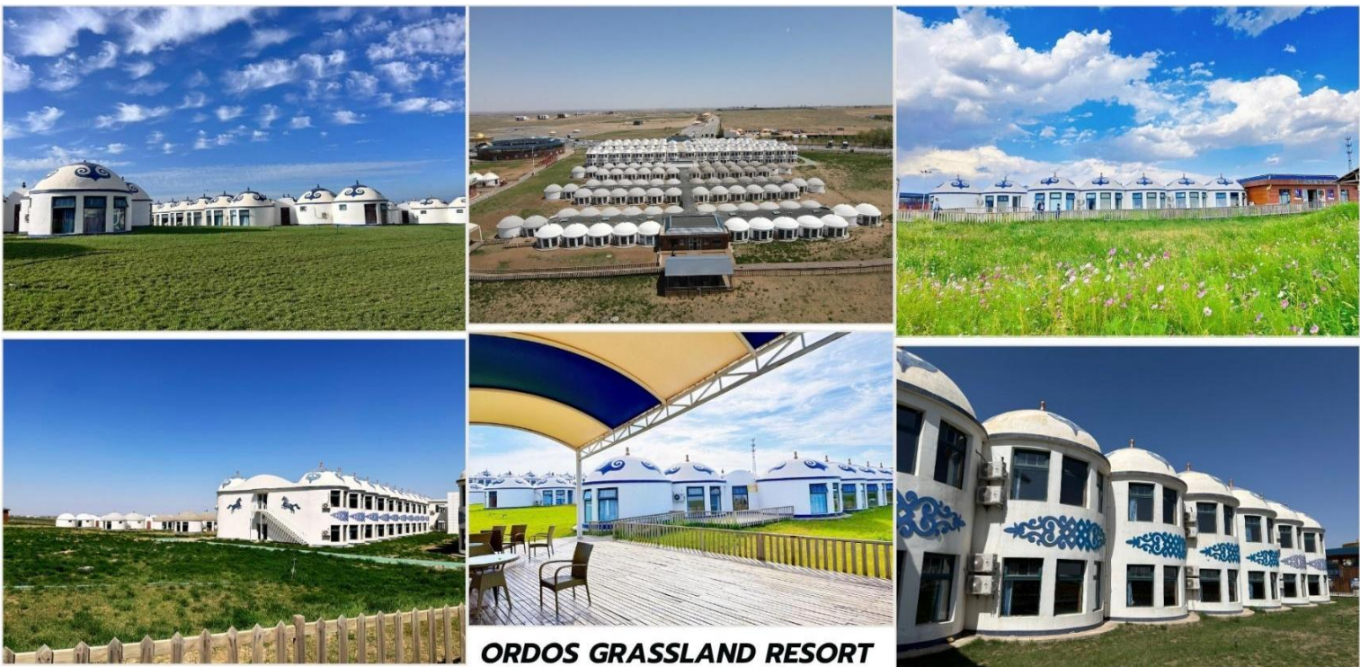
ORDOS GRASSLAND RESORT

***หมายเหตุ : สำหรับกรุ๊ปที่เดินทางช่วงเดือน เมษายน-พฤษภาคม ที่พักสไตล์มองโกลยังไม่เปิดให้บริการ จะเปลี่ยนเป็นพักโรงแรม ระดับ 4* แทน ในช่วงเวลาดังกล่าว