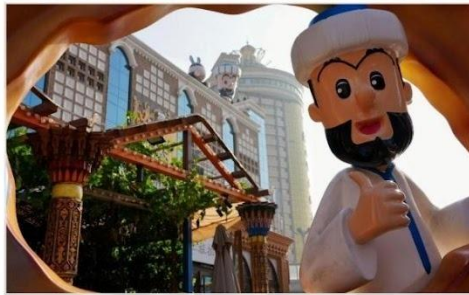
ตลาดนานาชาติซินเจียงแกรนด์บาร์ซาร์