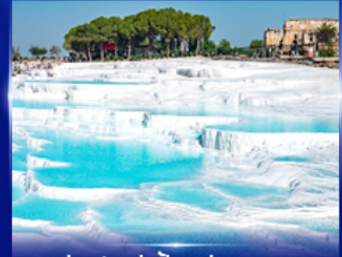
ปราสาทบุษบ้าย น้ำพุคคาเอ

OPTION JEEP SAFARI นั่งจี๊ปชมวิวคัปปาโดเกีย