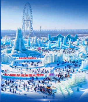
เทศกาลหิมะและน้ำแข็ง 2027