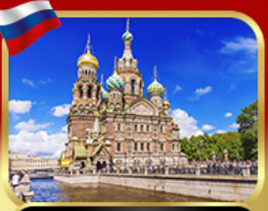
เข็ควินโบสกแห่งหยดเลือด