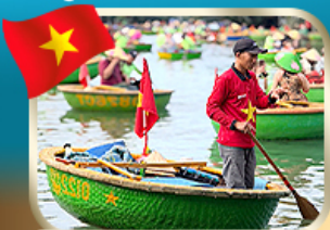
ล่องเรือกระดิ่ง ชมหมู่บ้านก๊อบกาน