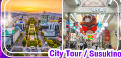
City Tour / Susukino