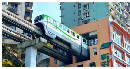
รถไฟฟ้าสุดคึก