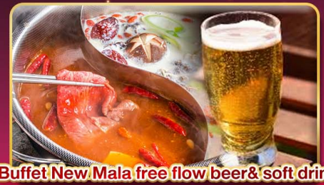
*Buffet New Mala free flow beer & soft drink