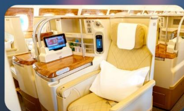
BUSINESS CLASS "บินกลับ"