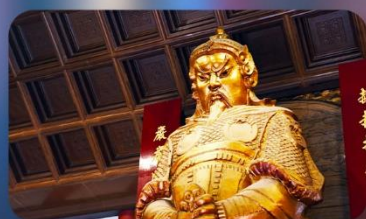
วัดแซงทมิว

THE LUXE MANOR HOTEL หรือเทียบเท่า 4-5 ดาว