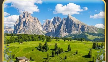
ชมวิวอลังการ alpe di siusi