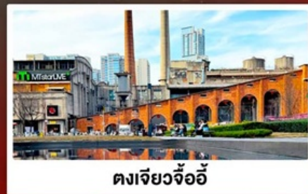
ตงเจียวจ้ออ๊