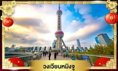
วงเวียนหมิงจู