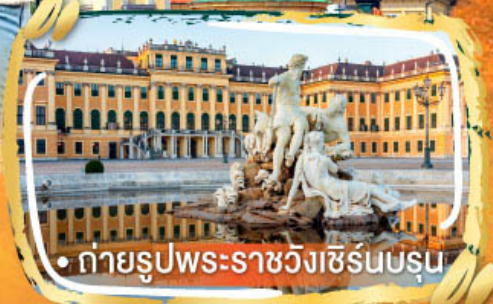
• ถ่ายรูปพระราชวังเซิร์นบรุน