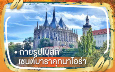
• ถ่ายรูปโบสถ์ เซนต์บาราคูนาโอร่า

ไฮไลท์ในโปรแกรม • บราติสลาวา เมืองเล็กแต่น่ารักเกินต้าน • เบอร์โน ซิลส์งาย สไตล์ยุโรปแท้ ๆ • คาร์โรวัวร์ เมืองน้ำแร่ • ซาลสบูร์ก เมืองคนครึ่ง วิวดิทุกมุม • วิวระดับโปสการ์ดที่อัลสติก • เวียนนา เมืองหรรุกลาสสิก สมมงยุโรปสุด ๆ