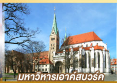
มหาวิหารเอาค์สเวิร์ค