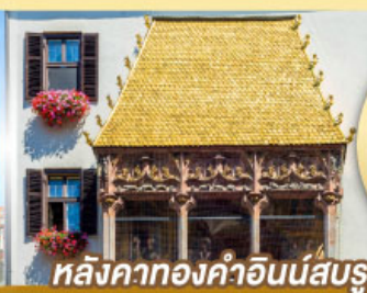
หลังคาทองคำอินน์สบูร์ค